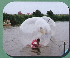
ウォーターボール