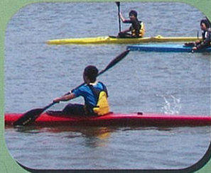
カヌーレース観戦