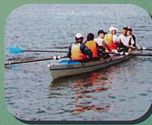
レガッタ走艇見学